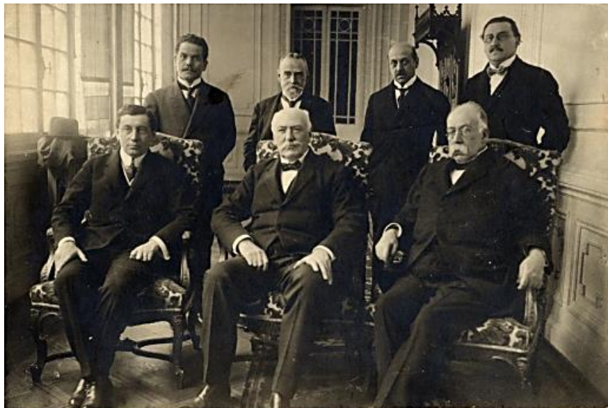
Noveno gabinete de Juan Luis Sanfuentes, de abril a septiembre de 1918, con Pedro Aguirre Cerda como ministro de Instrucción Pública y Arturo Alessandri como ministro del Interior.

Las atribuciones del Consejo Superior de Higiene fueron estudiar todas las medidas de higiene que exigían las condiciones de salubridad de las poblaciones, servir de cuerpo consultivo en todos los casos en que la autoridad lo requiriese, estudiar las medidas para asegurar la calidad de las bebidas y alcoholes y velar por el cumplimiento de los reglamentos que se dictaran sobre higiene y salubridad pública. No obstante, tuvo un papel pasivo, ya que su rol consultivo excluyó facultades para determinar acciones sanitarias o para prevenir epidemias u organizar la defensa contra las enfermedades infecciosas.