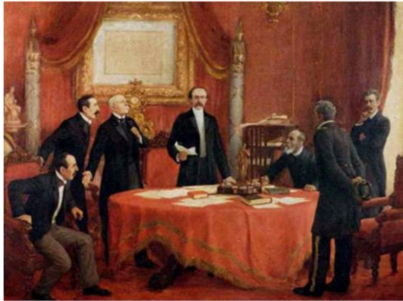
Presidente José Manuel Balmaceda en el Consejo de ministros del 7 de enero de 1891. Óleo de Pedro Subercaseaux.

Ante la evidente derrota militar, Balmaceda renunció para luego asilarse en la embajada argentina. Fue allí donde escribió su testamento político en el que expresó sus opiniones respecto de la situación del país tras el triunfo del Congreso, y delegó el mando al General Manuel Baquedano para que mantuviera el orden en Santiago. Los incendios y saqueos continuaron y tres días más tarde, Baquedano entregó el poder al bando vencedor. Al conocer la noticia, el presidente Balmaceda se suicidó y muchos de sus partidarios debieron exiliarse.