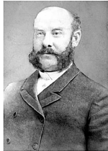
John Thomas North (1842 – 1896)

El Presidente Balmaceda impulsó una política económica y financiera de estilo nacionalista, donde se concebía al Estado como motor de la actividad económica, planteándose, incluso, como partidario de “nacionalizar” la industria del salitre pues, según él, la riqueza del salitre debía estar en manos de capitales chilenos. Esta política generaría conflictos con los intereses de los grandes banqueros, terratenientes, comerciantes y mineros extranjeros. Para algunos historiadores, como Ramírez Necochea y Julio Cesar Jobet, ésta sería la verdadera causa de la guerra civil: la lucha entre los poderes legislativo y ejecutivo representaba sólo un pretexto para el inicio del conflicto. Se habrían enfrentado realmente quienes eran partidarios de un programa de transformaciones en la línea de la revolución democrática burguesa liberal, representada por Balmaceda, y los sectores sociales en ascenso, contra los “contrarrevolucionarios”, representados por grupos financieros y mineros, unidos a los intereses del imperialismo inglés.