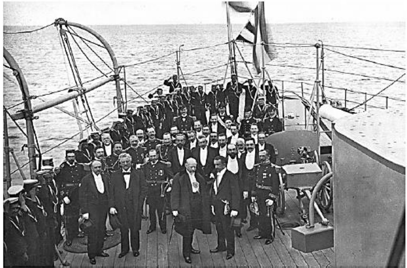
Los presidentes Errázuriz y Roca se reúnen en el estrecho de Magallanes en 1899, en el llamado "Abrazo del Estrecho".

Federico Errázuriz debió encarar la grave cuestión de límites con Argentina surgida por el tratado de 1881, referente a la Patagonia y al Estrecho de Magallanes, y la cuestión de la Puna de Atacama. El problema se originó debido a que producto de diversas negociaciones entre Argentina y Bolivia acerca de sus límites, esta última cedió parte de la puna ocupada por Chile a la nación argentina. En 1898 el problema llegó a su punto crítico y estuvo a punto de estallar una guerra. La cuestión de la Puna de Atacama se sometió al arbitraje de un ministro estadounidense en Buenos Aires quien manifestó que la mayor parte de este territorio quedaba en manos argentinas.