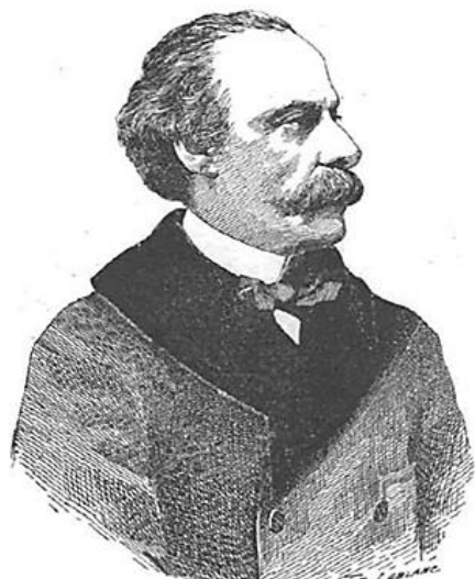
José Manuel Balmaceda (1840 - 1891)

Durante el gobierno de Domingo Santa María, las presiones que el Congreso ejercía sobre el Presidente de la República, mediante las prácticas parlamentarias (que dilataban la aprobación de las leyes), se dejaron sentir como nunca. Sin embargo, Santa María logró contar, por momentos, con un parlamento favorable e hizo triunfar al abanderado del gobierno en las elecciones de 1886.