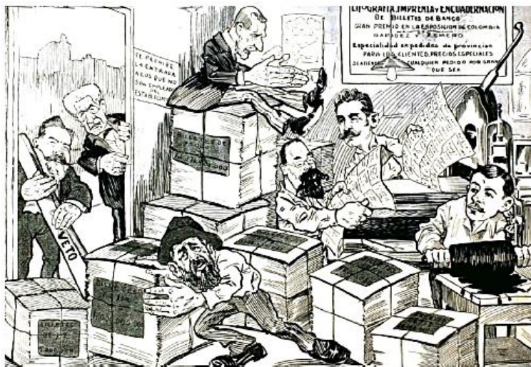
Caricatura sobre el intento del presidente de terminar con la emisión monetaria. (Zig Zag, 20 de enero de 1907)

Sin embargo, tres años más tarde se volvió nuevamente al papel moneda inconvertible en medio de la más grande polémica económica de la época entre "oreros", partidarios del sistema metálico, y "papeleros", partidarios de la inconvertibilidad. Ésta se extendería hasta 1920. ¿Por qué se dio esta indefinición?