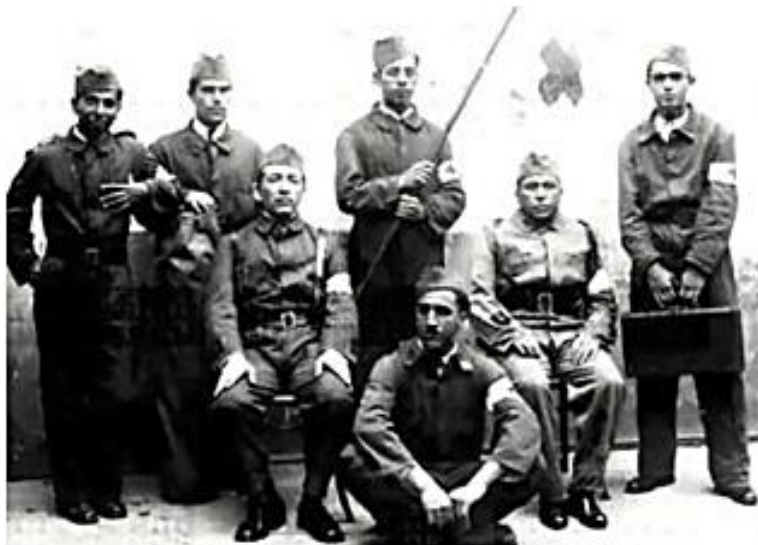
Milicias Republicanas, su lema era "Orden, Paz, Hogar y Patria"

Sus intentos por imponer el orden público se tradujeron en una política represiva hacia los sectores de izquierda. El gobierno logró hacer aprobar en 1937 una Ley de Seguridad Interior del Estado , en la que se tipificaba y penalizaba una serie de conductas como contrarias a la seguridad del Estado o al orden público; entre otros se incluían a los que promovían o estimulaban huelgas.