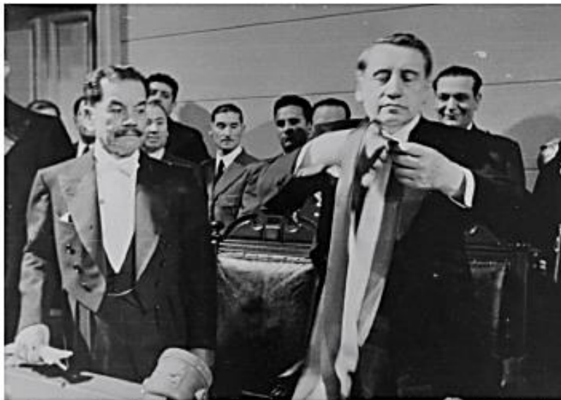
Ceremonia de cambio de mando en la cual Pedro Aguirre Cerda (izquierda) recibió la banda presidencial de Arturo Alessandri (1938).

El 25 de octubre de 1938 se realiza la elección presidencial, en la cual triunfa el candidato del Frente Popular Pedro Aguirre Cerda con un 50,2% de los votos frente al 49,3% de Gustavo Ross.