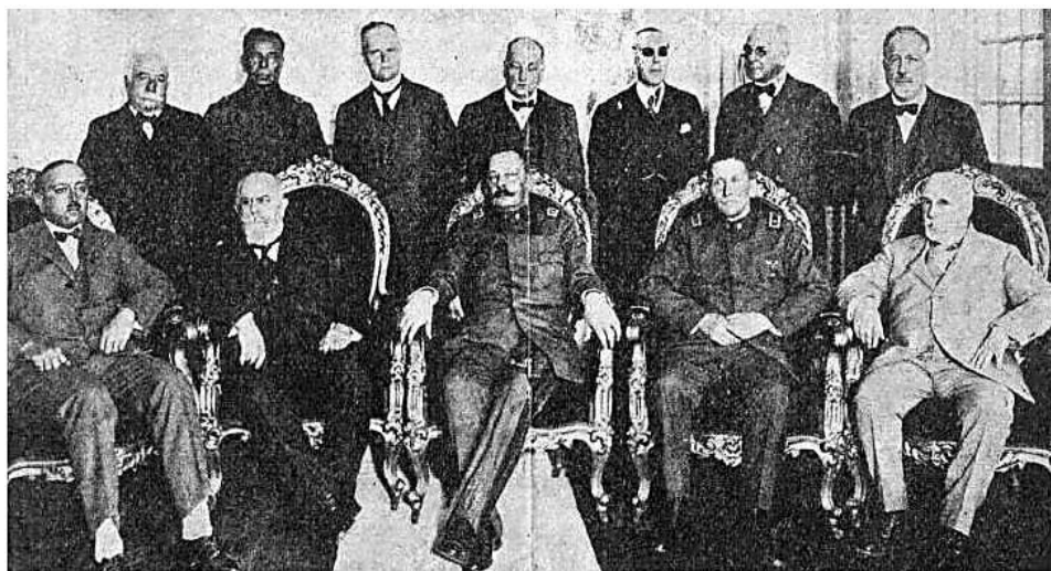
Junta de Gobierno de 1924, presidida por el general Luis Altamirano

Este golpe de Estado, sin embargo, no contó con el apoyo de los militares del movimiento del “ruido de sables”. Para ellos, el golpe era la reacción de la oligarquía que se veía amenazada por el gobierno de Alessandri. Se organizaron entonces como Comité Militar y tomaron contacto directo con