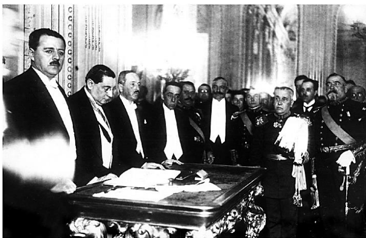
Arturo Alessandri encabeza la firma de la Reforma de la Constitución en el Salón Rojo del Palacio de La Moneda de Santiago.

Se estableció una Comisión Constituyente, integrada por 124 personalidades públicas. La Comisión sesionó entre abril y julio de 1925 y redactó un proyecto que se acercaba más a los postulados de los partidos políticos que a las ideas del Presidente. Cuando Alessandri recibió el proyecto de la Comisión, decidió redactar su propia versión final, en la cual incorporaba sus ideas y planteamientos. Luego, convocó a un plebiscito para el 30 de agosto, en el que votaron 134.421 ciudadanos (con un