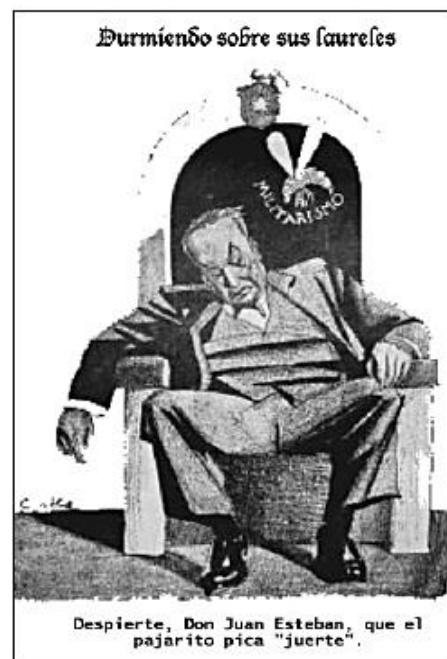
Revista Topaze, 1931

El 4 de junio de 1932 se produjo un golpe de Estado dirigido por el coronel de aviación Marmaduke Grove , comenzando así un periodo en el que se sucedieron cuatro gobiernos en cuatro meses.