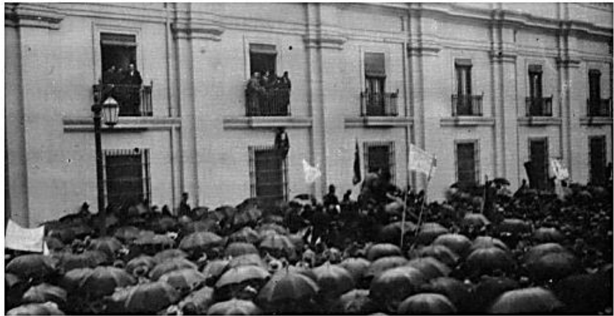
Marcha a favor de la República Socialista de Chile en junio de 1932

El primero de estos gobiernos fue el de la República socialista (4 al 16 de junio), dirigida por una Junta Revolucionaria. Esta Junta apenas pudo llevar a cabo algunas medidas de emergencia para resolver la aguda crisis económica y mejorar las condiciones de los sectores populares. En junio, el miembro de la Junta, Carlos Dávila , realizó un autogolpe apoyado por las fuerzas militares, destinado a