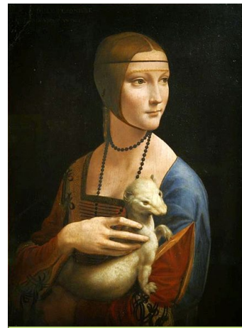
La dama del armiño, de Leonardo da Vinci