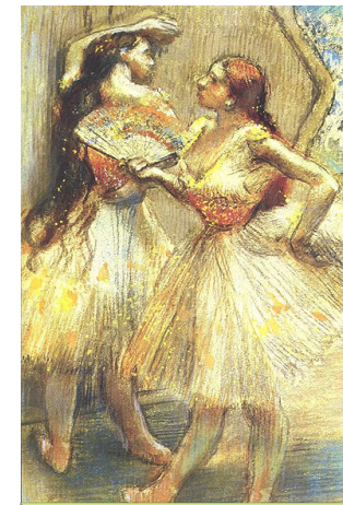
Dos bailarinas, de Edgar Degas